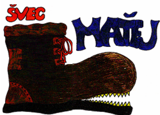
Domovní znamení ševce Matěje