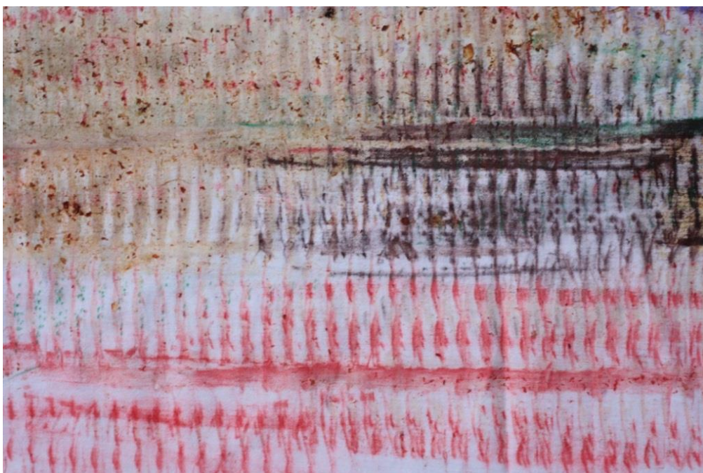
Dialog barev - frotáž realizovaná šťávou z jablka (rozpuštěný tvar) a suchým pastelem (práce ve dvojici)