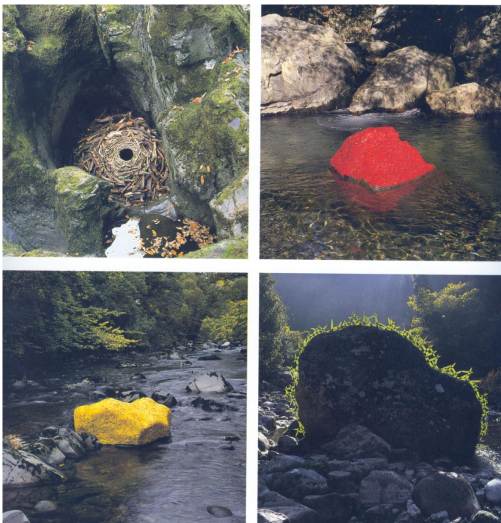
Tvorba A. Goldsworthyho (In ARTODAY. Současné světové umění, 1996, s. 116)

Tento autor vytvořil i mnoho instalací využitím barevného listí. Často jimi pokrýval vodní plochy, barevné listy připevňoval na mokré kameny, sešité do dlouhých tvarů umísťoval v krajině jako kontrastní barevné linie.