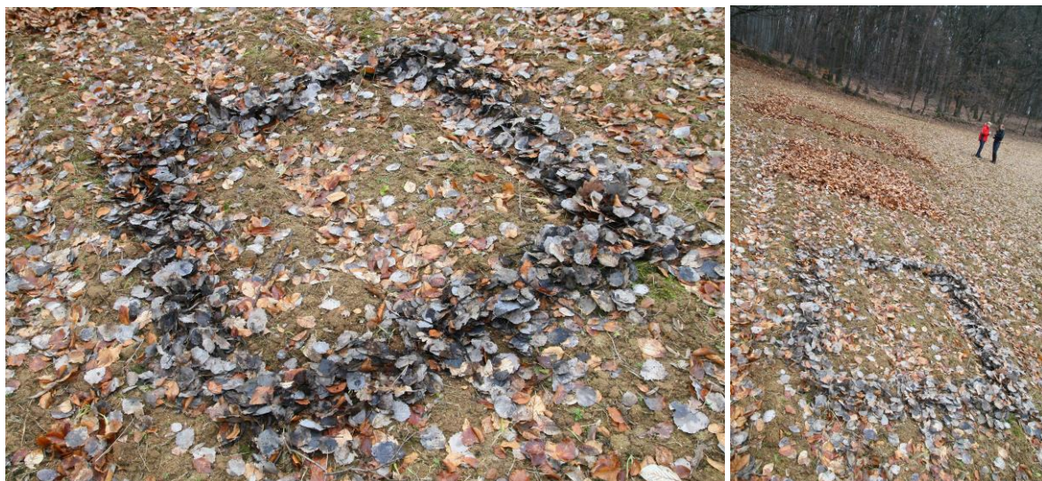
Tvorba studentek Učitelství pro 1. stupeň ZŠ inspirovaná land artem Ivana Kafky.

Mohou netradičně reagovat i na další běžné náměty, např. listy. Poté, co děti pozorují barevné členění plochy, pokračují ve velkorysé instalaci v přírodě. Znovu připomínáme, že námět souvisí především s motivací pro konkrétní činnost, která by měla směřovat k cíli – tedy, co chceme u dítěte rozvíjet, čemu je chceme naučit. Aktivní formou se mohou dozvědět o principech zemního umění (land artu), projevit tvořivé myšlení i smyslovou citlivost (např. ve vyhledávání a uplatnění v přírodě nalezených materiálů), spolupracovat ve skupině na velkoformátovém díle apod.