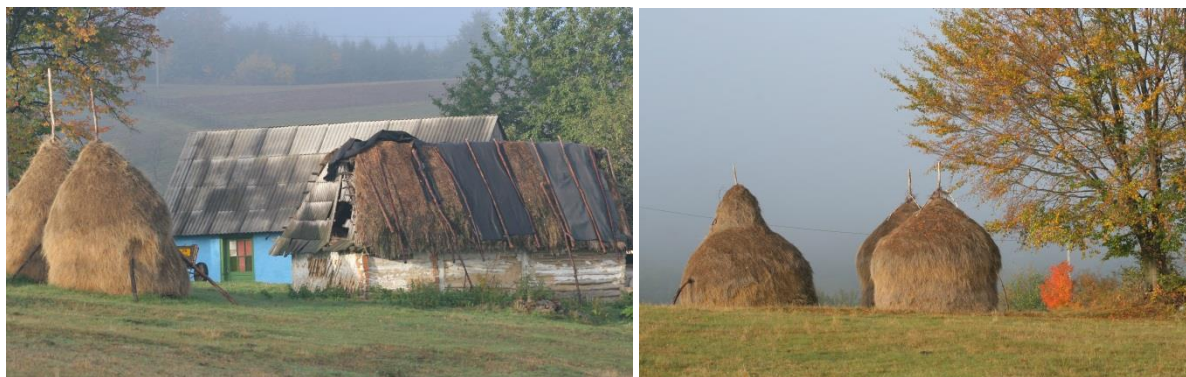
Krajina, kterou v Rumunsku osídlili Slováci