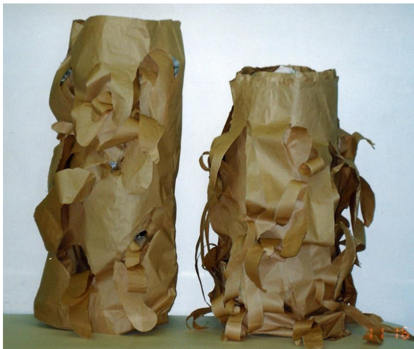
Papírové objekty (práce studentů oboru Učitelství pro 1. stupeň ZŠ)

Proměnit můžeme i další běžný předmět, a to papírový pytel. Nabízí se pohrát si s jeho povrchem, umožní nám to několik papírových vrstev, ze kterých je vytvořen. Plochy mohou být postupně odkrývány. Ponechejme na dětech, zda využijí stříhání, řezání či trhání. Vhodné je i skupinové řešení úkolu. Nejdříve pracujeme v ploše, až je plocha přetvořena, pytel můžeme vycpat a proměnit v jedinečný papírový objekt.