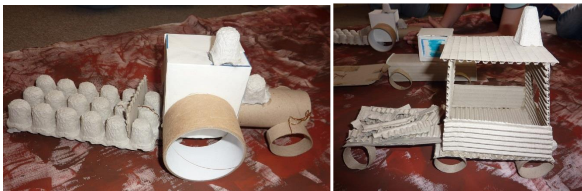
Prostorová tvorba dětí

K podzimnímu období v této lokalitě patří práce na poli. Lidé je dříve obdělávali tradičně - k pluhům, povozům svážející úrodu a dalším zemědělským strojům byli zapřaženi koně nebo krávy. Dnes lidem v jejich těžké práci vypomáhá i technika. Proto můžeme stále častěji vidět i traktory, na jejichž vlastnictví jsou všichni, včetně dětí, patřičně hrdi. Z tohoto důvodu můžeme pozorovat i ve spontánních kresbách místních dětí častěji než domácí zvířata právě zobrazení traktorů, automobilů a jiných technických vymožeností, které sem postupně pronikají (Ještě nedávno zde byly lokality, ve kterých nebyla elektřina.) Jistě by tedy uvítaly tvorbu objektů inspirovanou technickým světem. K výtvarné realizaci je možné využívat dostupného materiálu - papíru. Děti mohou nashromáždit nejrůznější druhy kartonů, ale také papírové krabičky, ruličky a jiné dostupné papírové tvary. Jednotlivé díly se dají spojovat svazováním a slepováním. Povzbuzujme děti, aby i detaily na objektech řešily z papíru a využívaly tak pestré škály vlastností nabízeného materiálu.