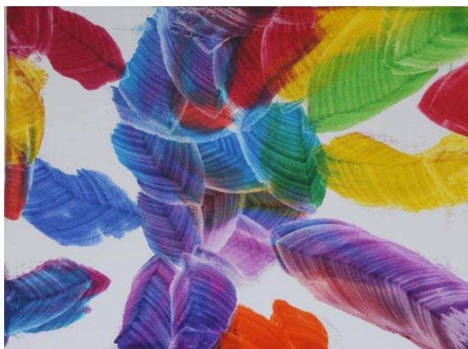
Enkaustika – malba voskem na malířské plátno, dětská práce

www.moravskagalerie.cz/media/694940/Antonín%20Procházka.doc