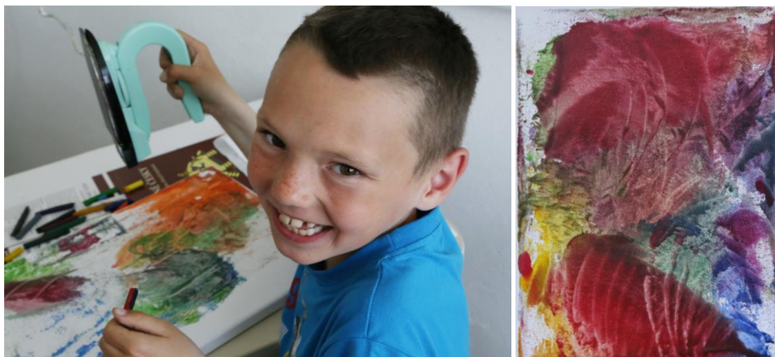
Malba žehličkou umožňuje experimentování s otiskem

Můžeme dětem nabídnout aktivní cestu ke zprostředkování díla významného umělce i prostor pro zkoumání malby voskem. Nabízí se využití speciálních žehliček na enkaustiku a voskových pastelů. Těmi je možné kreslit přímo na rozežhátou plochu nástroje a následně otiskovat na podkladový materiál. Zajímavé stopy mohou vzniknout posunem žehličky, jejím otáčením, otiskováním hrany a dalším pohybem - nechejme děti experimentovat a objevovat možnosti, jak koncipovat barevné plochy, není nutné jim určovat námět, nabízet ukázky již vytvořených děl apod. Nabízí se i mnoho příležitostí pro rozvíjení představivosti, např. při interpretaci vzniklé formy.